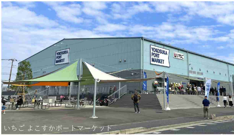
いちごよこすかポートマーケット