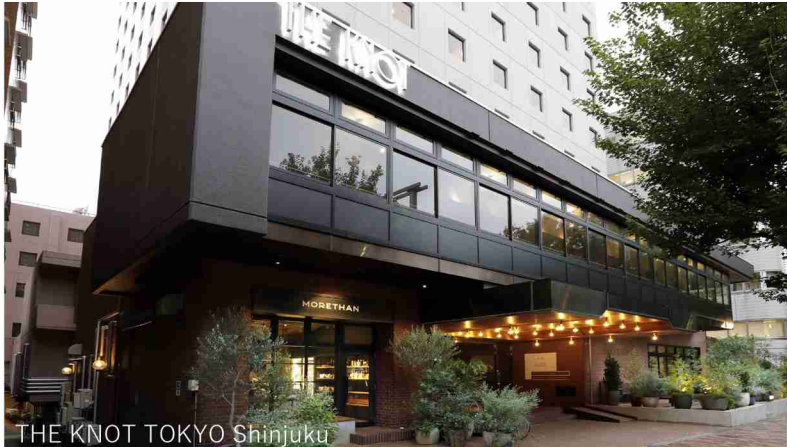
THE KNOT TOKYO Shinjuku