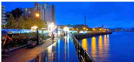
フォトコンテスト部門へ大賞～「五月雨のヴェルニー公園」