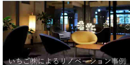
いちご(株)によるリノベーション事例